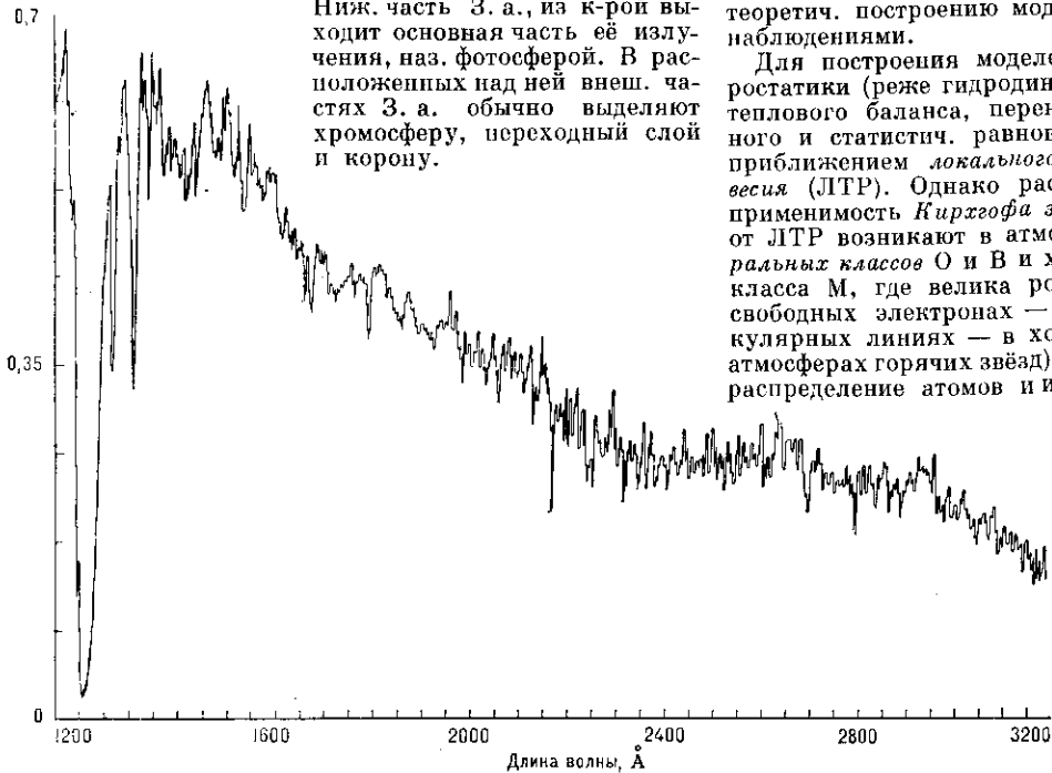
Рис. 1. Спектр излучения звезды \alpha Leo (B7V). По вертикальной оси — плотность потока, \text{эрг}/(\text{см}^2 \cdot \text{с} \cdot \text{см}) .

Ниж. часть З. а., из к-рой выходит основная часть её излучения, наз. фотосферой. В расположенных над ней внеш. частях З. а. обычно выделяют хромосферу, переходный слой и корону.