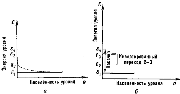
Рис. 2. Накачка четырёхуровневой системы: распределение населённости уровней равновесное (а) и в условиях накачки перехода \mathcal{E}_1 - \mathcal{E}_4 (б).

Возможны более сложные схемы Н. квантовых систем, напр. четырёхуровневая схема Н. лазера на ионах неодима. Осуществить насыщение квантовых переходов в оптич. диапазоне с помощью нелазерных тепловых источников Н. очень трудно. С др. стороны, в условиях теплового равновесия при обычных темп-рах практически все квантовые частицы находятся на самом ниж. уровне. Выбрав вещество с четырьмя уровнями энергии, при благоприятных соотношениях скоростей релаксац. переходов между уровнями можно получить инверсию разности населённости уровней \mathcal{E}_2 и \mathcal{E}_3 (рис. 2) и