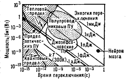
Рис. 5. Сравнение предельных характеристик устройств памяти различных типов.

Сравнение предельных характеристик П. у. разл. типа приведено на рис. 5.