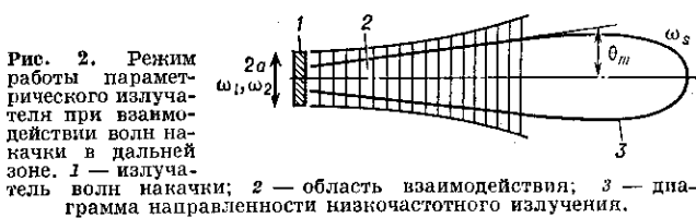
Рис. 2. Режим работы параметрического излучателя при взаимодействии волн накачки в дальней зоне. 1 — излучатель волн накачки; 2 — область взаимодействия; 3 — диаграмма направленности низкочастотного излучения.

2) Гл. вклад в генерацию НЧ-волны даёт нелинейное взаимодействие в дальней зоне излучения волны накачки, где она становится расходящейся и область взаимодействия имеет форму рупора (рис. 2). При этом НЧ-