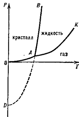
Рис. 1. Линия плавления AB на диаграмме состояния чистого вещества: A — тройная точка равновесия кристалл — жидкость — газ, K — критическая точка, AD — экстраполяция линии плавления за тройную точку.

Линия фазового равновесия кристалл — жидкость, отвечающая равенству химических потенциалов фаз \mu_{крис}(T, P) = \mu_{ж}(T, P) , начинается в тройной точке A чистого вещества (рис. 1) и прослеживается до давлений \sim 10 ГПа. Если в системе происходит полиморфное превращение (см. Полиморфизм ), то линия П. имеет излом в тройной точке кристалл I — кристалл II — жидкость. У ряда веществ с изменением темп-ры и давления наблюдается более двух полиморфных превращений.