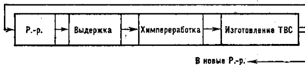
Рис. 2. Топливный цикл.

Регенерация состоит из хим. переработки, при к-рой происходит очистка от осколков, и изготовления ТВС. Несмотря на предварит. выдержку, радиоактивность топлива остаётся высокой, что требует дистанц. произ-