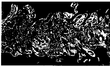
Рис. 7. Двумерное сечение струи, визуализированной красителем, флуоресцирующим в поле лазерного излучения. Число Рейнольдса Re = 4 \cdot 10^3 , изображенная область простирается от 8d до 24d ( d — диаметр струи) (K. R. Sreenivasan, 1991).

ных вихрей к мелким. В его модели при Re = U l_0 / \nu исходное течение является неустойчивым (здесь U — скорость течения, l_0 — его характерный глобальный масштаб). Развитие неустойчивости ведёт к его разрушению и образованию вихрей с размерами l_1 < l_0 и скоростями u_1 < U . Поэтому число Рейнольдса Re_1 = u_1 l_1 / \nu , рассчитанное для вновь образовавшихся вихрей, несколько меньше, чем Re = U l_0 / \nu . Но при достаточно больших числах Рейнольдса исходного течения Re_1 также достаточно велико, Re_1 \gg 1 , и эти вихри также неустойчивы. Поэтому они преобразуются во вторичные вихри с размерами l_2 и скоростями u_2 , меньшими, чем l_1 и u_1 , и т. д. Этот процесс рождения вихрей идёт до тех пор, пока число Рейнольдса, рассчитанное по размерам и скорости на n -ом шаге каскада, не станет примерно равным критическому Re_c , при k -ром вихри устойчивы и диссипируют из-за вязкости.